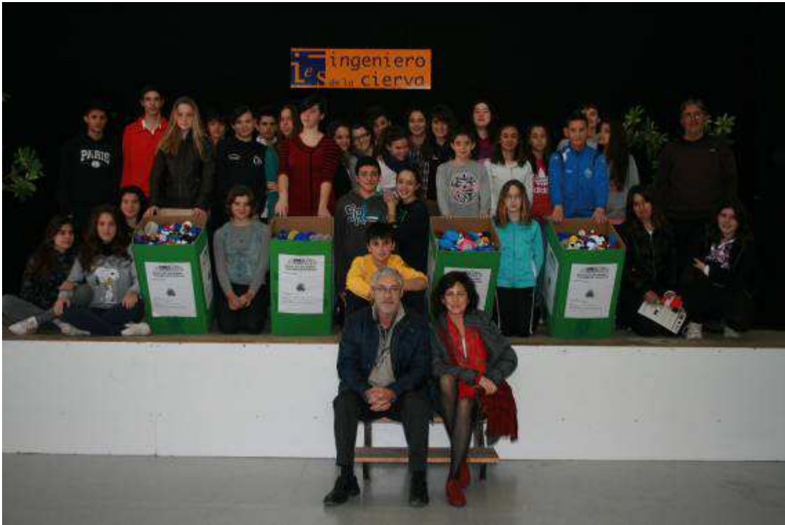
LOS PRIMEROS CUATRO CONTENEDORES DE TAPONES