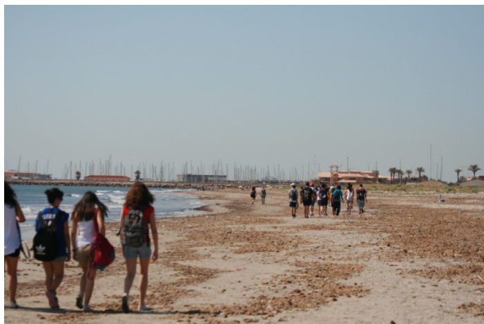
Salida a un medio natural