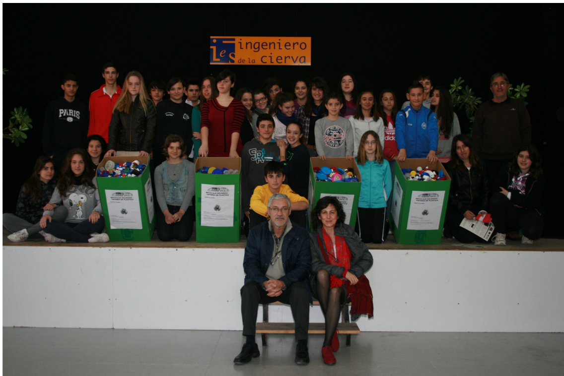
LOS PRIMEROS CUATRO CONTENEDORES DE TAPONES