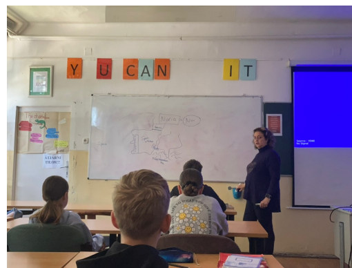
Participación en actividades de aula e intercambio metodológico