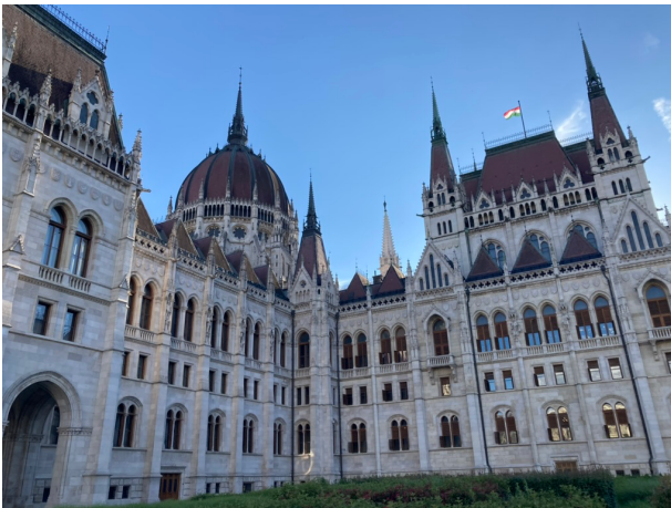
Parlamento de Budapest