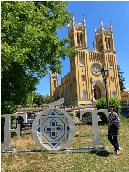
Basílica de Fót, referente patrimonial de la localidad anfitriona

Durante la estancia, las participantes tuvieron la oportunidad de conocer diversos elementos del patrimonio histórico y cultural de Hungría. Las visitas realizadas permitieron profundizar en la historia del país, comprender mejor su contexto social y educativo y acercarse a aspectos relacionados con sus tradiciones, gastronomía y patrimonio artístico.