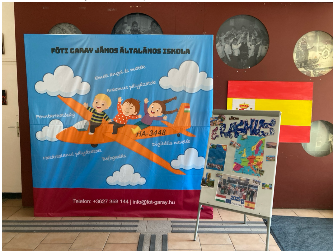
Panel informativo y exposición de proyectos europeos del centro anfitrión

Centro/Entidad de acogida: Fóti Garay János Általános Iskola.