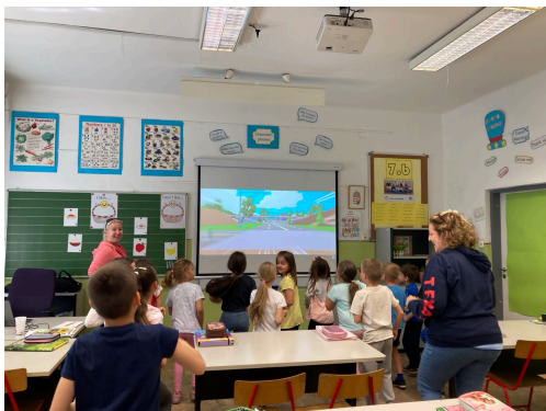
Sesión de inglés en niveles iniciales basada en participación activa y aprendizaje dinámico

A lo largo de la semana se observaron clases de inglés en diferentes niveles educativos, prestando especial atención a las metodologías empleadas, la organización del aula y la participación del alumnado. Destacaron el uso constante del inglés como lengua vehicular, las actividades de interacción oral, el trabajo cooperativo, el andamiaje lingüístico y la atención a diferentes ritmos de aprendizaje. También se analizaron herramientas digitales como KRÉTA y Mentimeter, así como los sistemas de comunicación con familias y gestión académica. Las profesoras anfitrionas explicaron estrategias metodológicas y resolvieron dudas sobre planificación, evaluación y organización escolar.