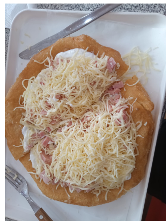
Goulash y lángos, platos típicos