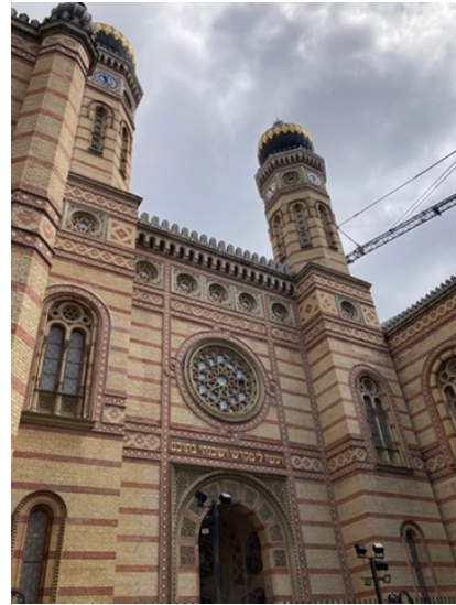
Gran Sinagoga de Budapest