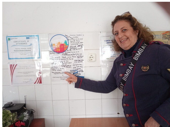
Póster realizado por los alumnos de nuestro centro en su visita a Fót en noviembre de 2025