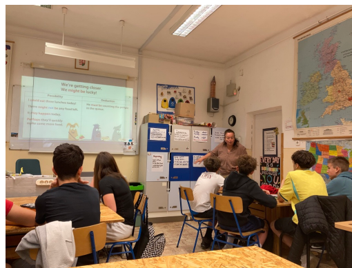
Observación de una clase de inglés en niveles superiores, centrada en el desarrollo de la competencia comunicativa y la participación activa del alumnado