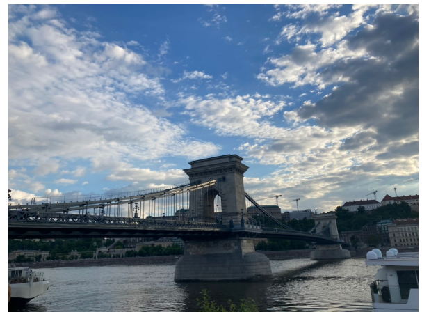
Puente de las Cadenas