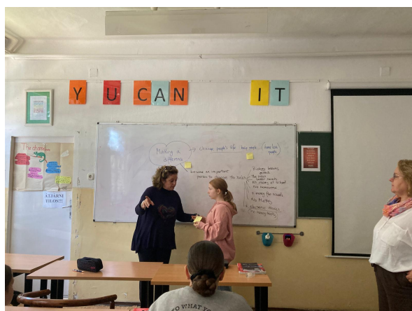
Interacción con el alumnado