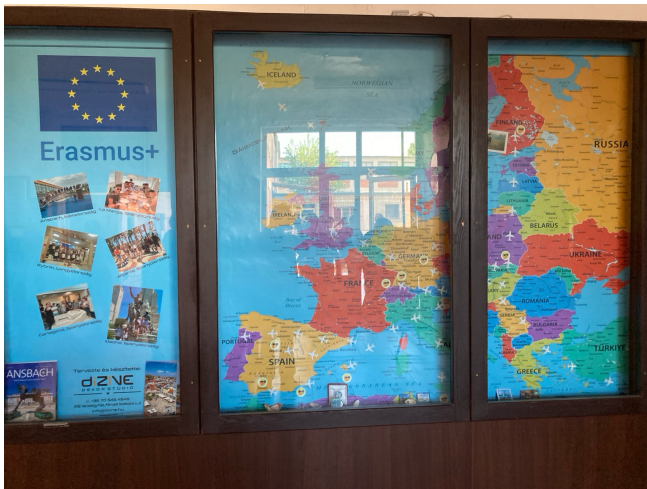
Mapa de movilidades y proyectos internacionales desarrollados por el centro

Uno de los aspectos más interesantes observados fue la integración de la dimensión europea en la vida cotidiana del centro. El alumnado participa regularmente en movilidades internacionales y los proyectos Erasmus+ tienen una presencia visible mediante exposiciones, mapas de destinos, materiales de difusión y recuerdos de intercambios realizados.